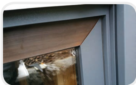
Detailfoto einer Fensterecke: von Braun nach Basaltgrau

Als ein von RENOLIT SE geschulter Betrieb zur „nachträglichen Profil-Kaschierung am Objekt“ bieten wir Ihnen auch Reperatur- und Ausbesserung für folierte Fensterrahmen an. Z.B. nach Einbaufehler, Kratzer, Ablösen der Folie oder Einbruch. Mit identischem Dekor/Farbtönen ihrer bisherigen Fenster – kein Unterschied erkennbar. Wir sichern Ihnen ein professionelles Ergebnis zu.